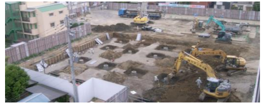
平成27年2月 病歴棟・宿舎解体