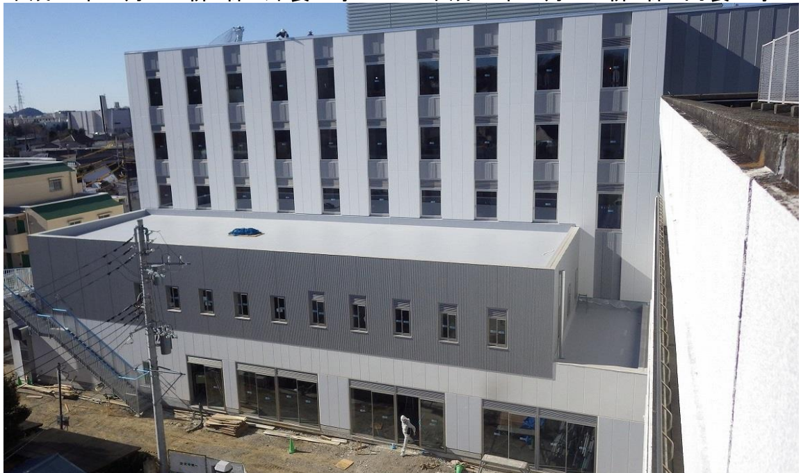
平成28年1月8日現在 新B棟 外構工事 3月完成……6月より運用を開始します。